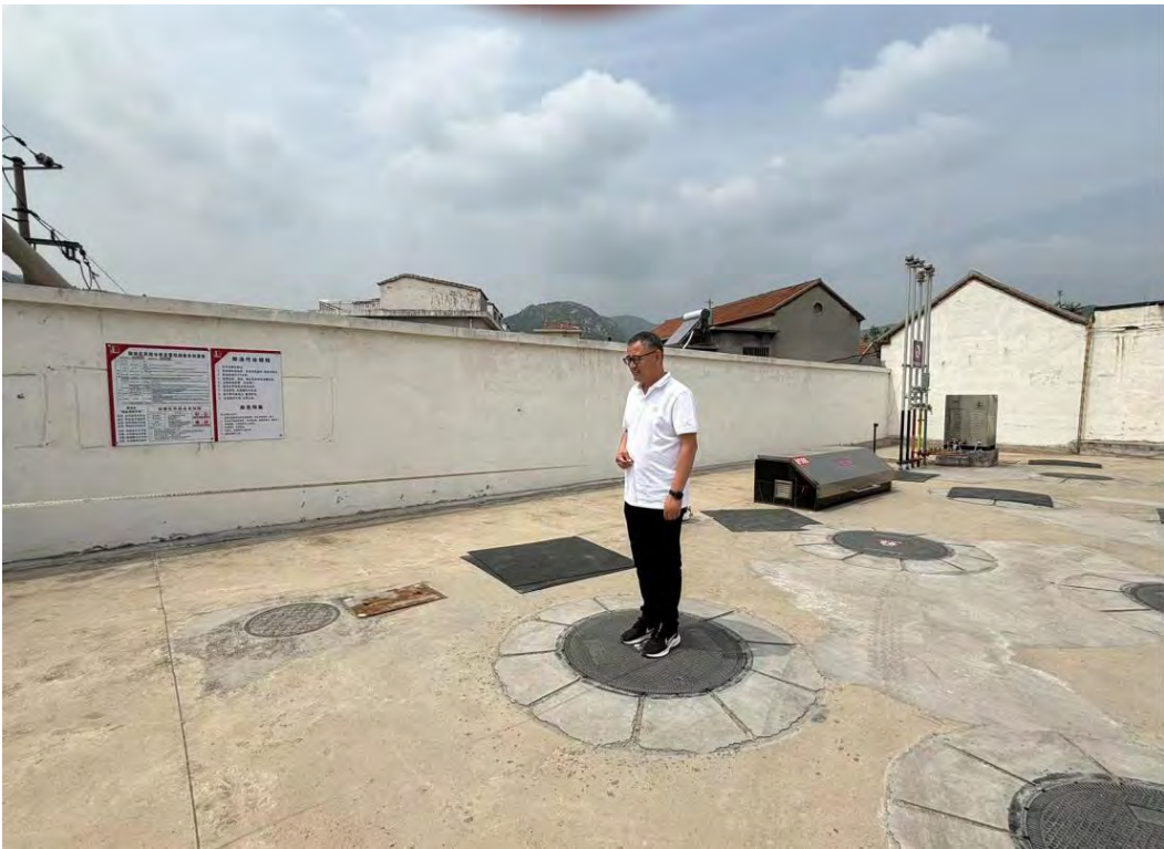
中国石化销售股份有限公司山东莱芜第十四加油站现场照片