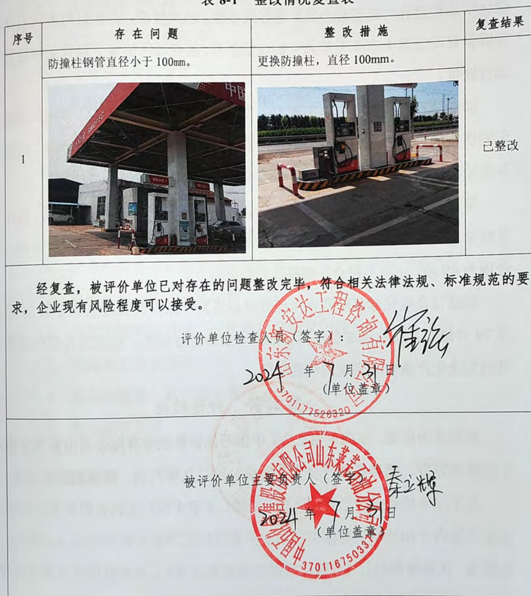
表 8-1 整改情况复查表

整改后经复查，中国石化销售股份有限公司山东莱芜第六十加油站对不合格项进行了整改，整改情况见下表。