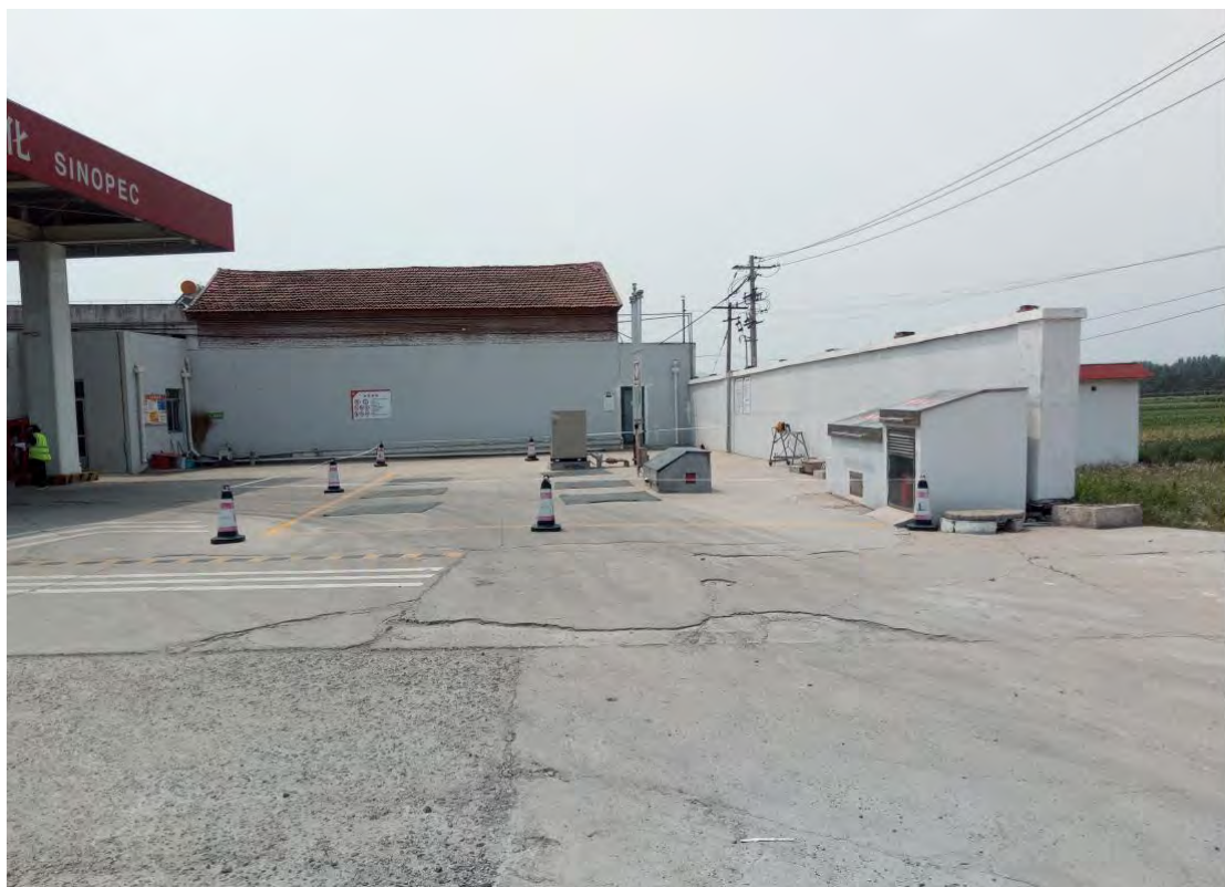
中国石化销售股份有限公司山东莱芜第六十加油站现场照片