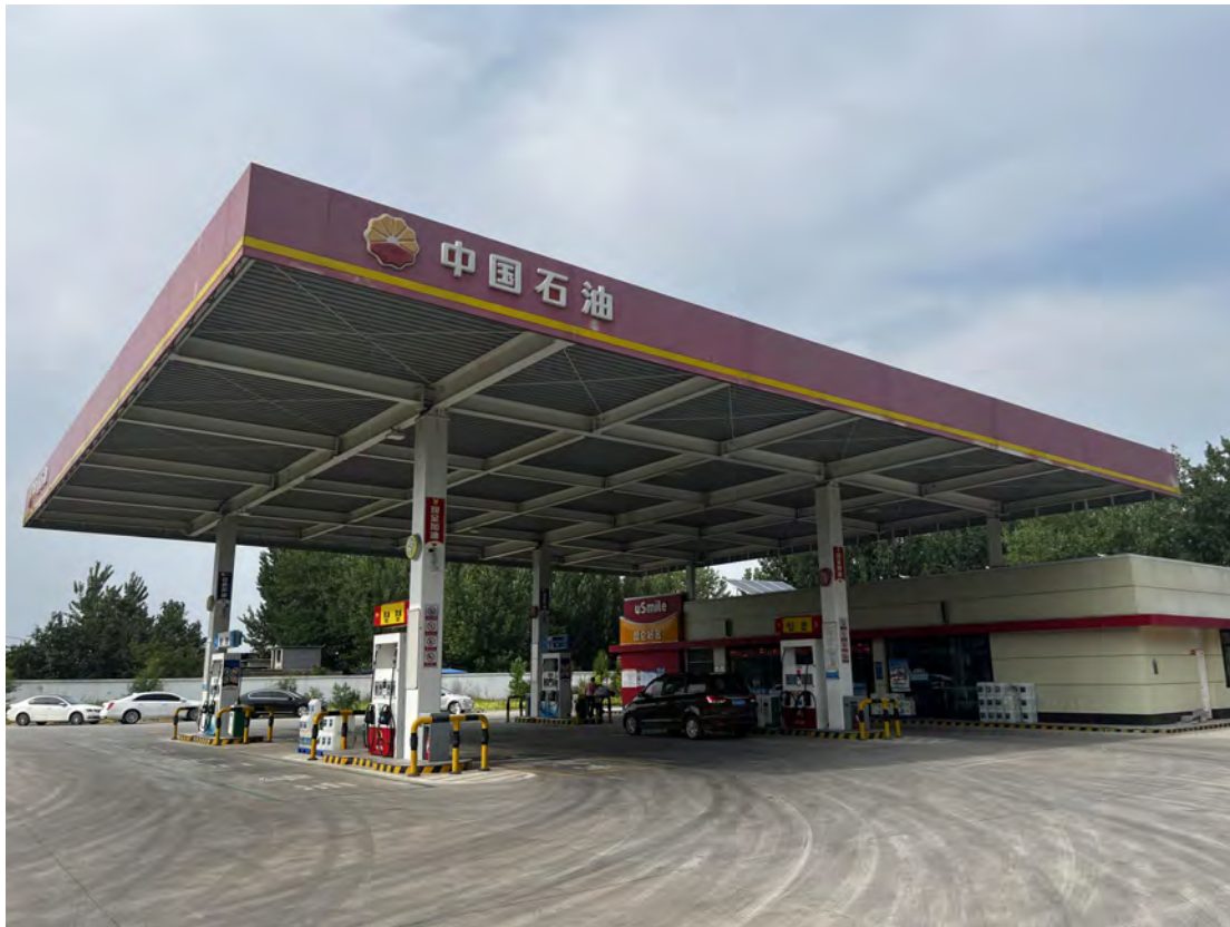
中国石油天然气股份有限公司山东菏泽销售分公司开发区福州路加油站现场照片