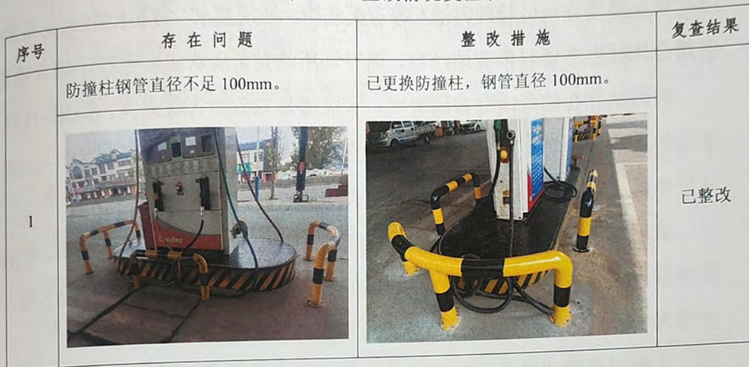
表 8-1 整改情况复查表

经复查，被评价单位已对存在的问题整改完毕，符合相关法律法规、标准规范的要求，企业现有风险程度可以接受。