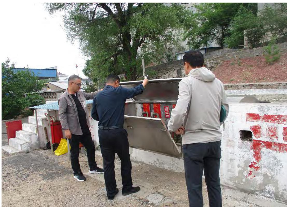
莱芜市颜庄供销合作社生产资料供应站现场照片