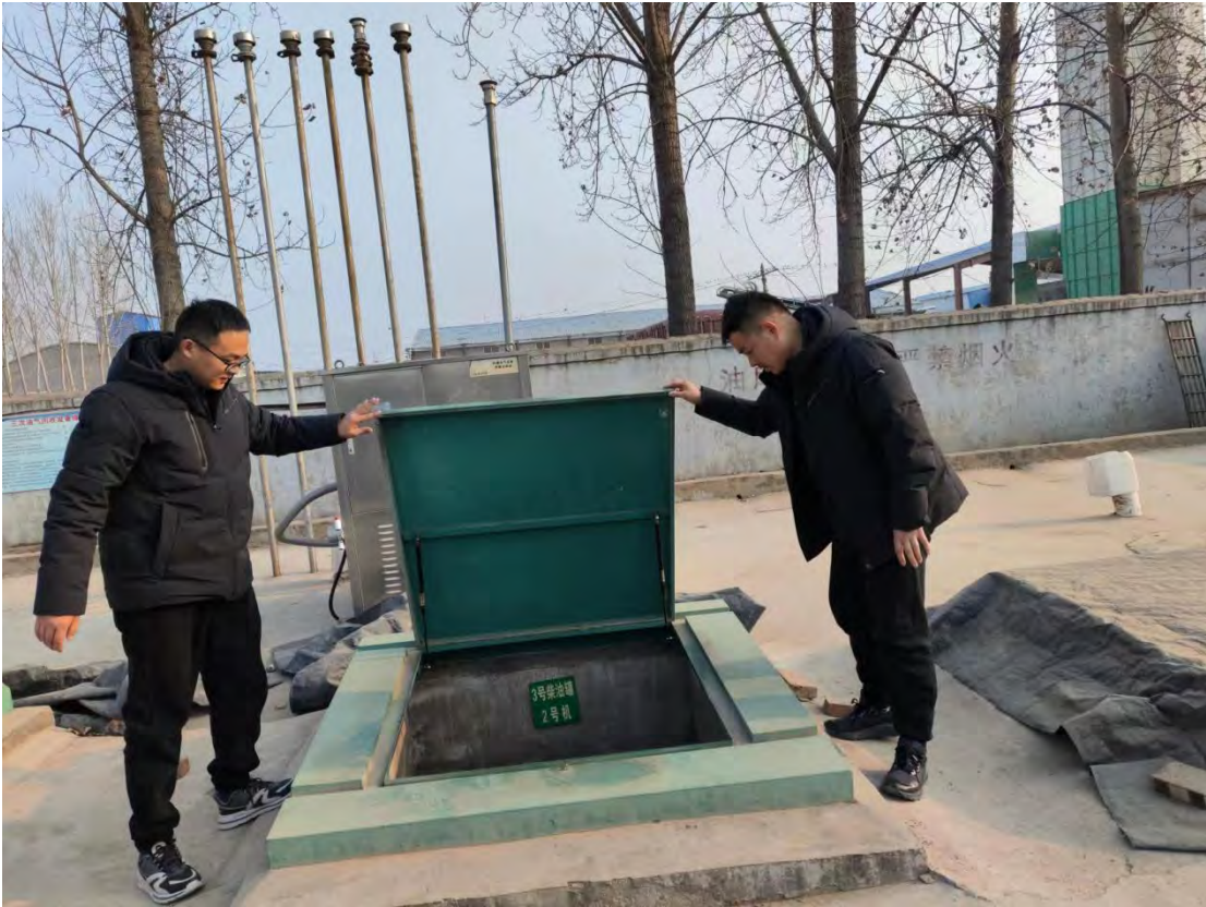
菏泽市牡丹区久龙加油站现场照片