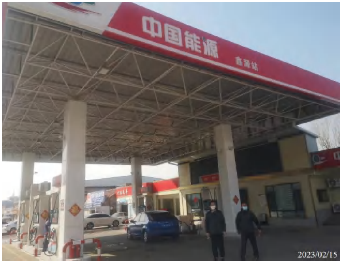
高密市鑫源成品油销售有限公司现场照片